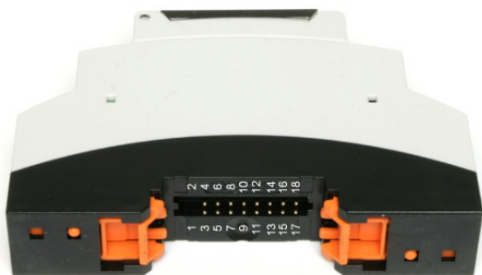
Abbildung 1: Pinbelegung BUS Connector